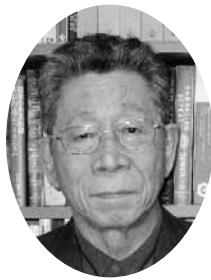
公益財団法人日本クリスチャン・アカデミー理事